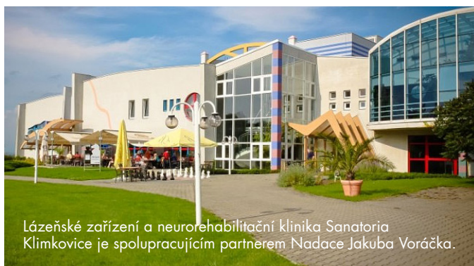
Lázeňské zařízení a neurorehabilitační klinika Sanatoria Klimkovic je spolupracujícím partnerem Nadace Jakuba Voráčka.

Základem neurorehabilitace klientů s roztroušenou sklerózou je citlivě zvolený pohybový režim sloužící ke stabilizaci a zlepšení fyzické kondice. Neurorehabilitační programy zaměřené na stabilizaci roztroušené sklerózy v Sanatoriích Klimkovic využívají multidisciplinárních strategií ke zvýšení funkční nezávislosti, prevence komplikací a zlepšení kvality života nemocných. Díky přímé návaznosti práce fyzioterapeutů, psychologů, ergoterapeutů a logopedů dochází k významnému zlepšení klinických projevů onemocnění RS. Pohybová terapie pomáhá předcházet rozvoji bolesti a jiných komplikací a případně rozvoje funkčních poruch hybného systému. Stabilizace fyzické kondice dokáže pozitivně ovlivnit také psychický stav klienta.